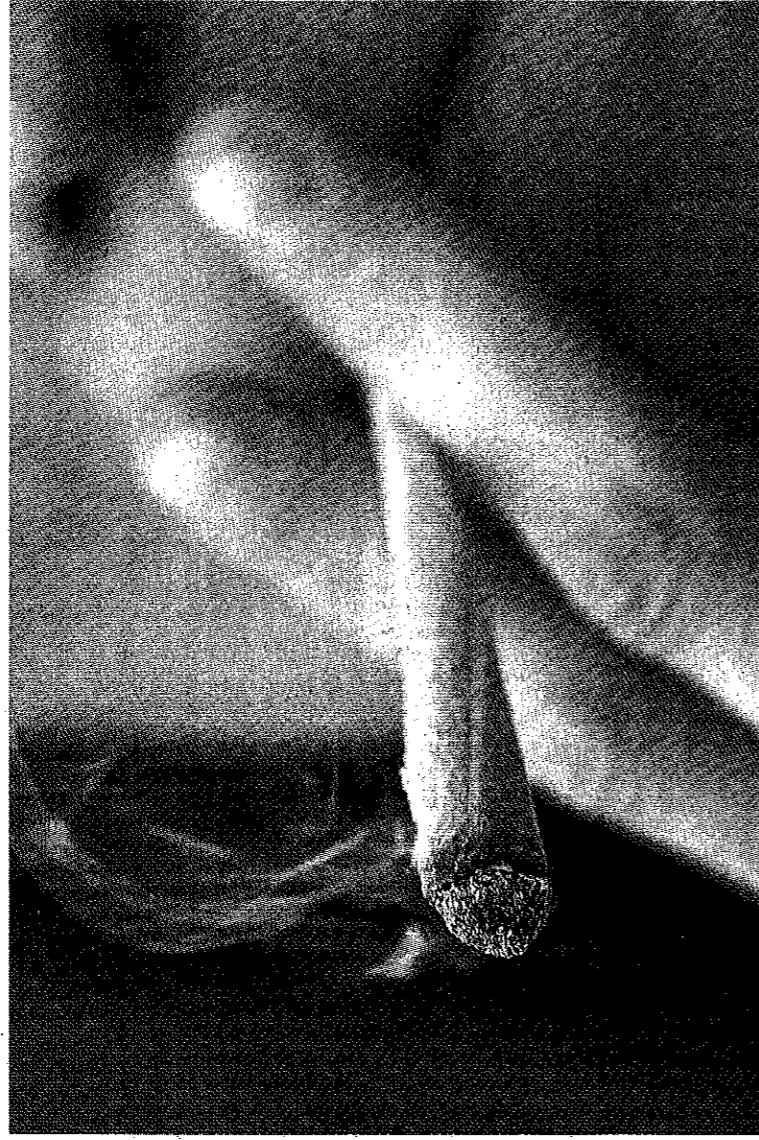
La Policía Local abrió un expediente sancionador a 105 chicos y 31 chicas.

«En qué consiste esta actividad? Sus responsables lo definen como «un recurso psicoeducativo basado en entrevistas motivacionales para