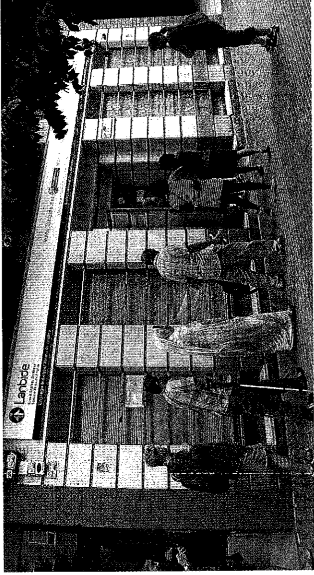
Varias personas esperan su turno en una oficina de Lanbide.

La Brigada de Extranjería de la Policía Nacional destapó su presencia hace ya tres años. Su investigación reveló la existencia de «una mafia» especializada en amañar pasaportes argelinos para, entre otras trampas, cobrar prestaciones sociales. A principios de año, este cuerpo —con la